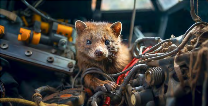
© Adobe Stock - David Brown (generiert mit KI)